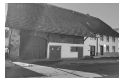
ZELL I. W. (1)