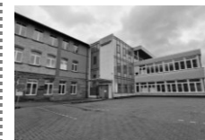
ST. GEORGEN (1)